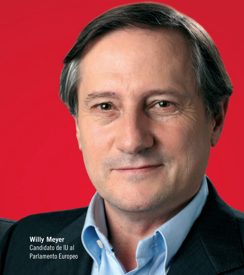
Willy Meyer Candidato de IU al Parlamento Europeo